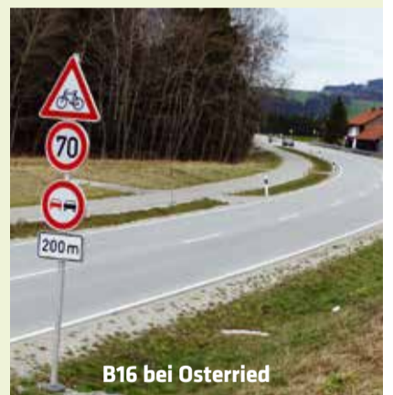
B16 bei Osterried

Ein lange bestehender Wunsch vieler Bürger erfüllte sich Anfang des Jahres: Im Bereich der Querung der B16 durch die „ Dampflokrunder “ bei Osterried wurde die höchstzulässige Geschwindigkeit auf 70 km/h gesenkt. Das Staatliche Bauamt folgte mit dieser Maßnahme der von Bürgern und Stadtrat vorgetragenen Anregung.